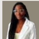
Sefeoluwa Building Services Engineer Belgia

“ The programme has given me great insight into using my strengths in the corporate world. I've had amazing opportunities to learn more about the principles of my discipline. I'm gaining hands-on experience working on projects for top pharmaceutical clients.”