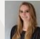
Daria Graduate Architect Polska

“ The first year of the programme exceeded my expectations! I learned a lot about different sectors within my industry. I met great people with whom I can grow and learn. Also the meetings with mentors allow me to manage my career development.”